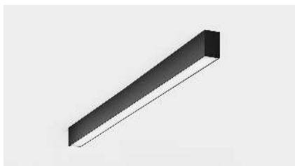
Ceiling light type - CLT-02

Item Height: 8.4 CM Item Length: 98 CM Item Width: 5.6 CM Type of light source : LED Power consumption,W: 26W CCT,K: 2200 K Input Voltage, V: 220-240V, 50HZ IP Code: IP65 Case material: Aluminium Color: Paint grey