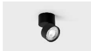
Ceiling light type - CLT-01

Item Height: 8.2 CM Item Length: 7.5 CM Item Width: 7.5 CM Item Weight: 0.485 kg Type of light source : LED Power consumption,W: 12W CCT,K: 3000 K Input Voltage, V: 220-240V, 50HZ IP Code: IP40 Case material: Aluminium Color: Black 9005